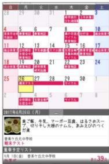
奈良登美ヶ丘北中学校区の事例 学校給食献立配信